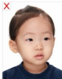
Mirada de lado

Aplican los mismos lineamientos que para las fotos de adultos. No deben salir juguetes en la foto. Los recién nacidos pueden salir con la boca abierta si se les dificulta mantenerla cerrada.