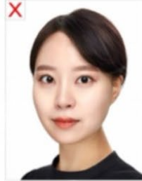
Foto de perfil

Debe estar mirando al frente (no poses de perfil), mostrar una expresión natural sin sonreír o fruncir el seño. Mantenga el rostro sin cubrir y con las orejas y frente descubierta. No joyería.