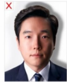
Sombras de fondo