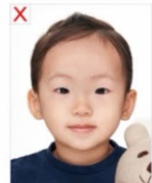
Objetos a la vista